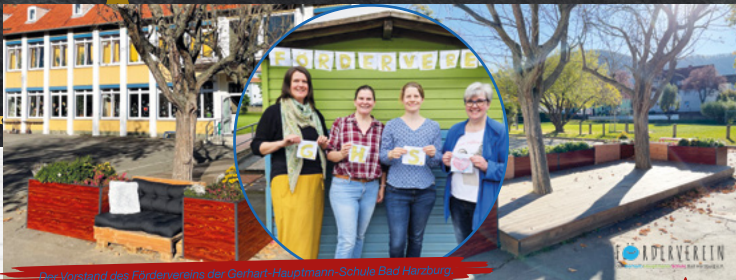
Der Vorstand des Fördervereins der Gerhart-Hauptmann-Schule Bad Harzburg.